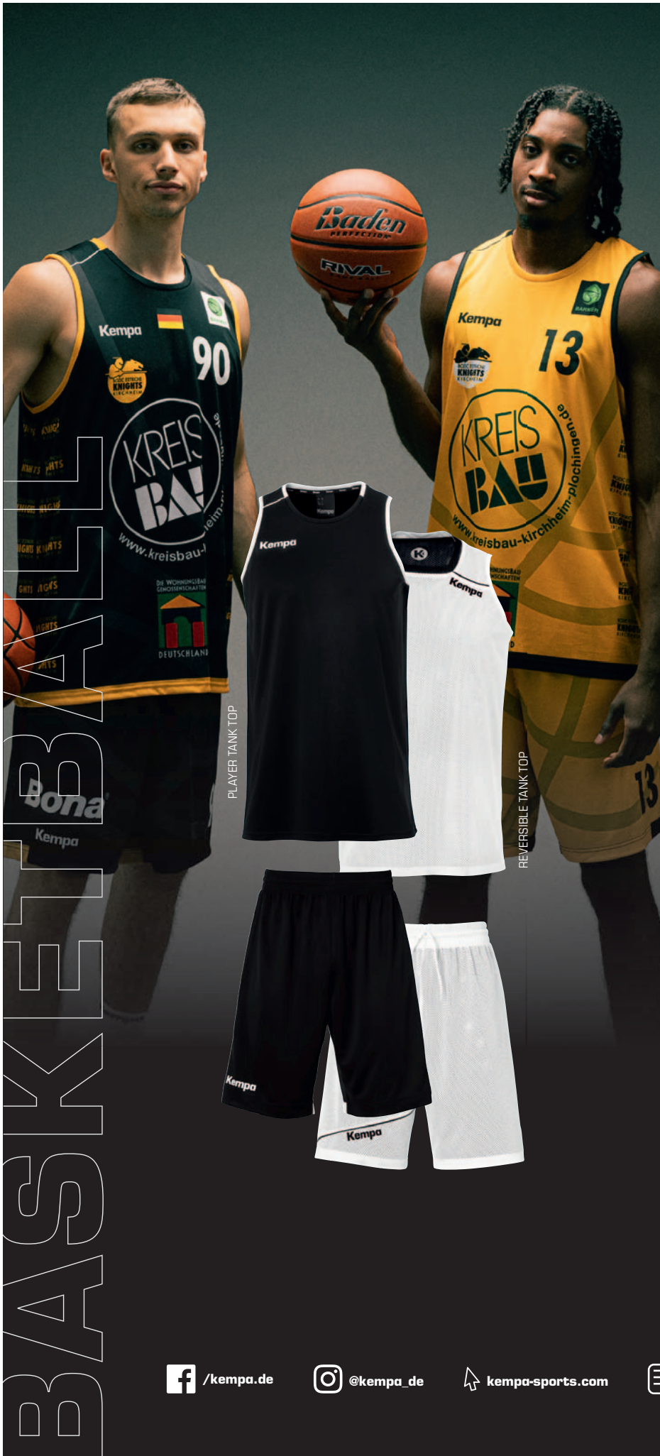
PLAYER TANK TOP