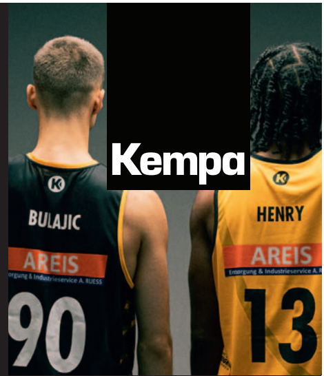
REVERSIBLE TANK TOP